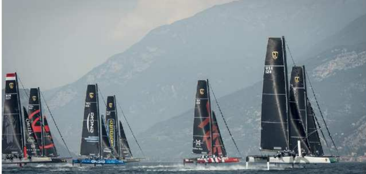
High Speed Start mit über 35 Knoten.

Bei seiner GC32 Premiere mit dem Prinzensohn Csairaghi wäre es fast zu einer schweren Kollision mit dem schweizer Armin-Strom-Team von Klassenboss Flavio Marazzi gekommen. Csairaghi konnte erst im letzten Moment das Ruder herumwerfen. In der Folge legte sich der Katamaran auf die Seite.