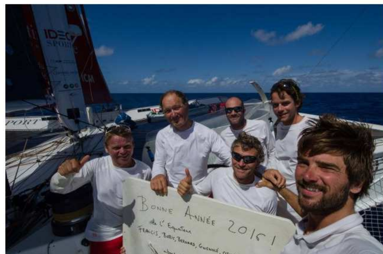
Das IDEC Team ist noch bester Laune.