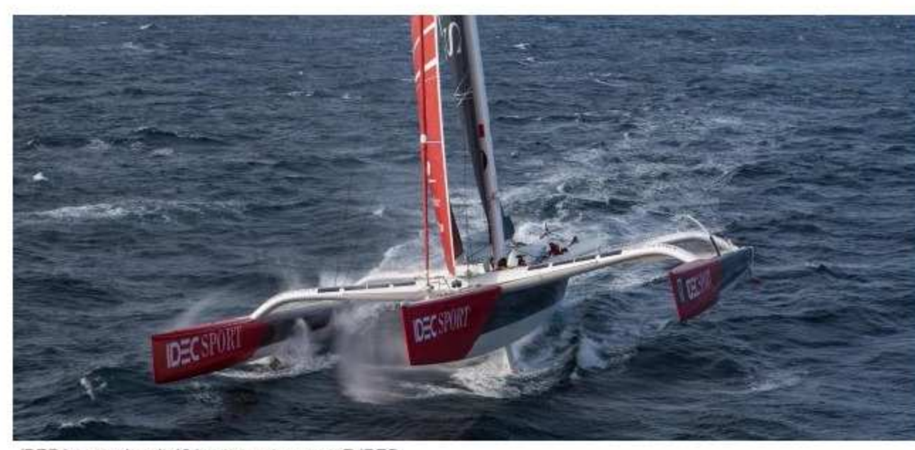
IDEC ist gerade mit 40 Knoten unterwegs.

Die beiden Teams auf ihren rasenden Trimaranen haben bekannt gegeben, dass sie keine Chance mehr sehen, den Rekord zu brechen. Nun droht auch noch ein Sturm.