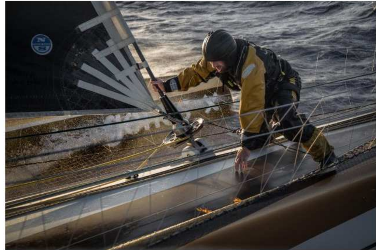
Die Arbeit wird nicht leichter auf dem Spindrift Vorschiff.

Grund ist die Wetterlage. Das Azoren-Hoch hat sich genau im Weg Richtung Ziel positioniert. Zuerst schien sich noch eine kleine Chance aufzutun, an der Sperre vorbei zu schlüpfen. Aber dann änderte sich die Entwicklung, und nun ist der Rekordversuch aussichtslos geworden. "Wir müssen einen Umweg von gut 1000 Meilen segeln", sagt ein enttäuschter Guichard.