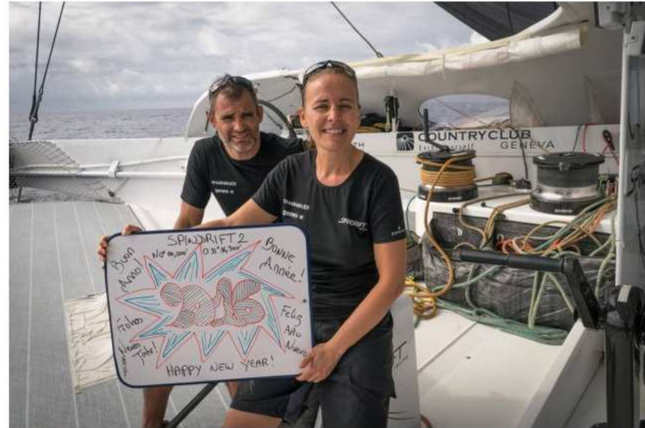
Der Skipper guckt zum Neuen Jahr etwas gequält.

Dennoch würde ihn sicher freuen, vor "Spindrift" im Ziel zu sein. Es wäre ein Sieg ohne Wert aber ein echter Prestige-Erfolg. Deshalb werden beide Crews noch nicht vollständig vom Gas gehen.