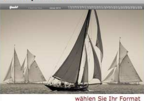
wählen Sie Ihr Format