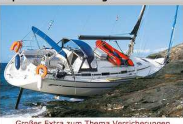
Großes Extra zum Thema Versicherungen...