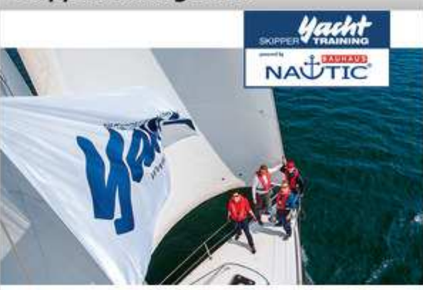
Anmeldung zum YACHT Skippertraining ...