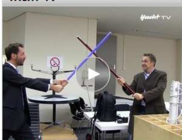
GUTEN RUTSCH! Pleiten, Pech und Pannen 2015