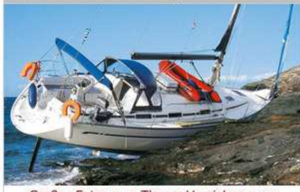
Großes Extra zum Thema Versicherungen...