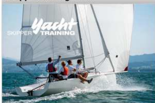
Anmeldung zum Skippertraining...