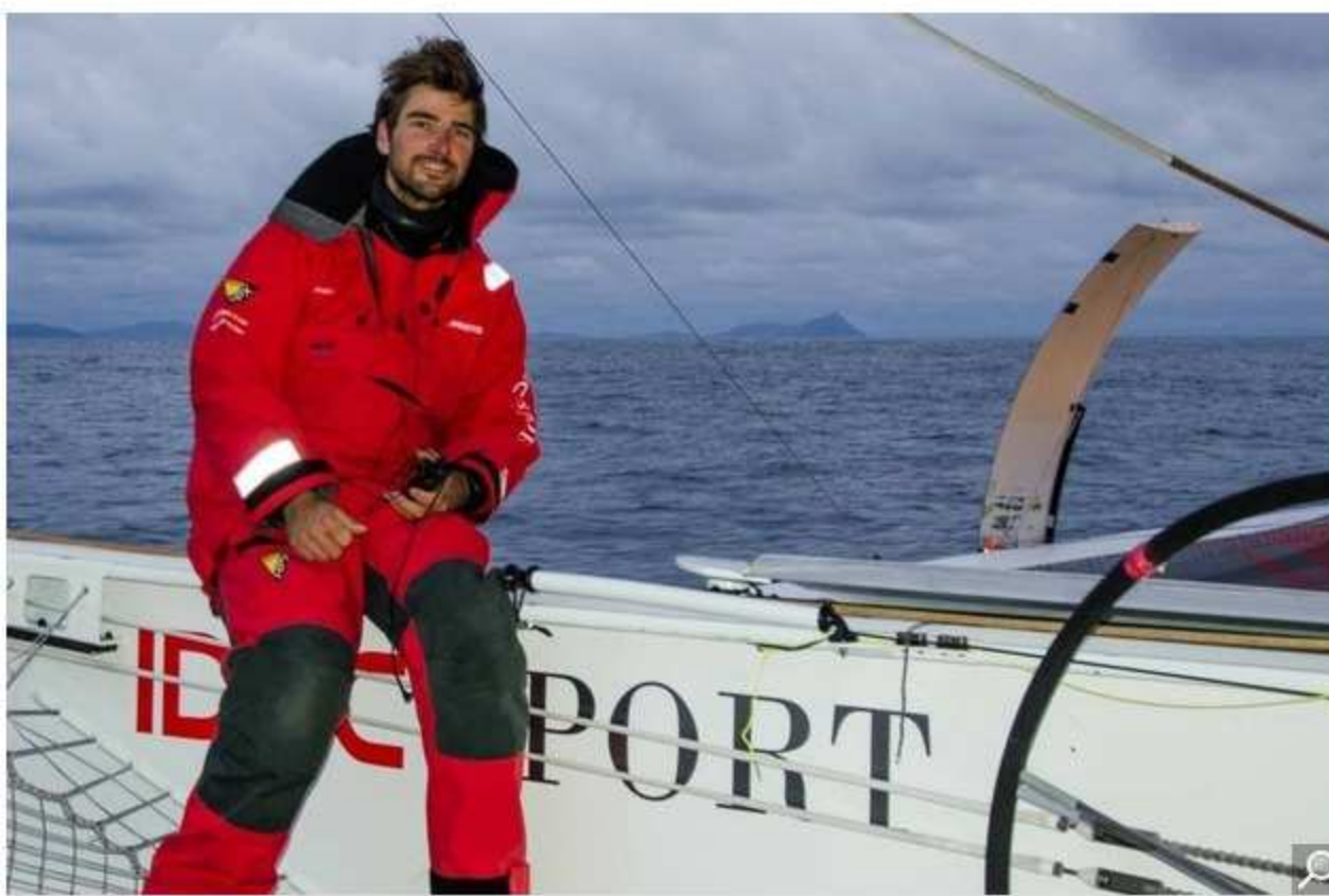
War als erster Deutscher auf Jules-Verne-Rekordfahrt, doch eine neue Bestmarke bleibt auch ihm verwehrt: Boris Herrmann

"Wir haben unaufhörlich gekämpft", sagte Yann Guichard, "aber wir haben keine Chance mehr den Rekord zu brechen. Das Wetter hat unser Schicksal besiegelt." Weil das Azorenhoch den direkten Weg ins Ziel blockiert und schwere Stürme vorausliegen, sei die See laut Guichard nicht navigierbar. "Die Bedingungen auf dem Atlantik machen es der Crew unmöglich, die Weltumsegelung rechtzeitig zu beenden", hier es in einer "Spindrift 2"-Pressemittteilung. Außerdem: "Von heute an ist die Crew der "Spindrift 2" gezwungen, den Fuß vom Gaspedal zu nehmen."