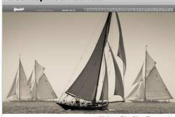
wählen Sie Ihr Format